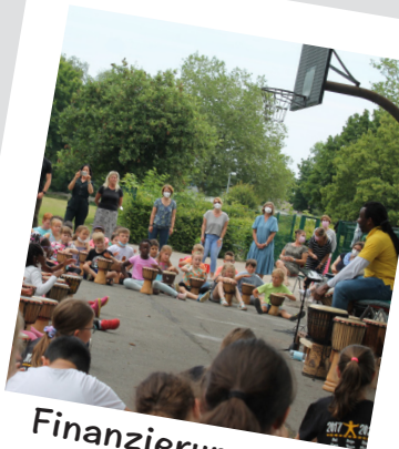
Finanzierung des Trommelzaubers

Gemeinsam lassen wir die Kinder strahlen!