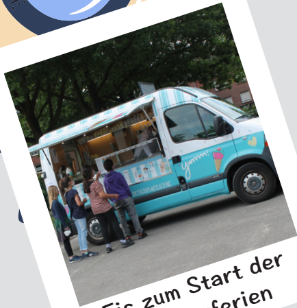
Eis zum Start der Sommerferien

Gemeinsam lassen wir die Kinder strahlen!